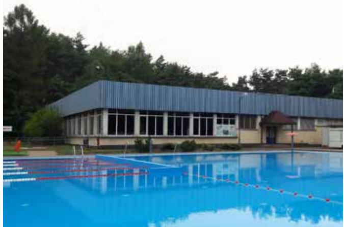
OGŁOSZENIE UMIG OLKUSZ

W lipcu tego roku do użytku została oddana, przebudowana i zmodernizowana część odkryta zespołu basenów przy ul. Kamiennogórskiej.